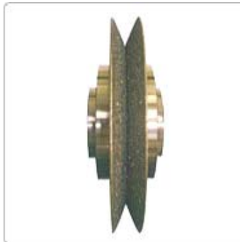
應用七：齒研用鑽石滾輪