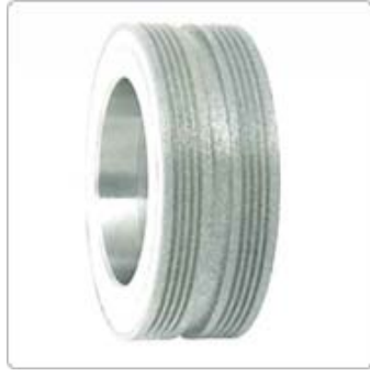
應用二：牙研用 - 鑽石滾輪