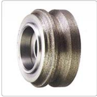
應用四：斜進式滾輪