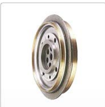
應用十一：溝研用鑽石滾輪