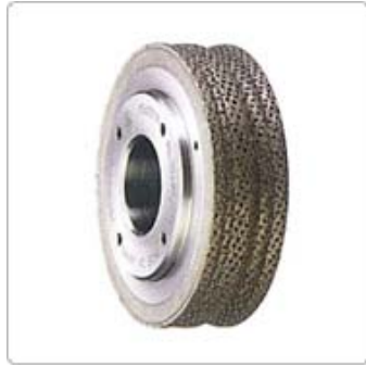
應用五：滾珠螺桿用鑽石滾輪