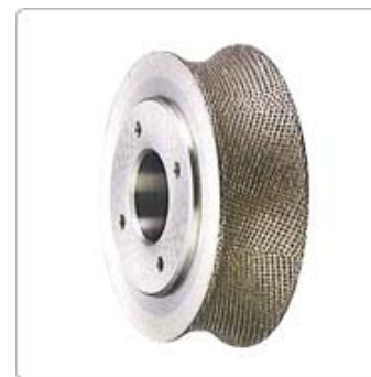
應用八：CVJ 連軸器用鑽石滾輪