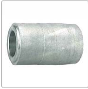
應用一：無心磨-成型鑽石滾輪