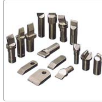
應用六：鑽石修整器