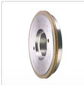
應用十：凸輪研磨用鑽石滾輪