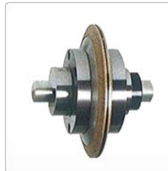
應用十二：齒研用鑽石滾輪