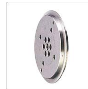
應用九：CVJ 連軸器用鑽石滾輪