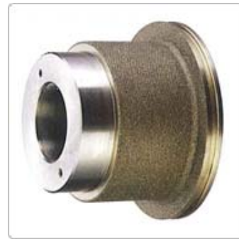
應用三：線軌 / 滑塊用鑽石滾輪